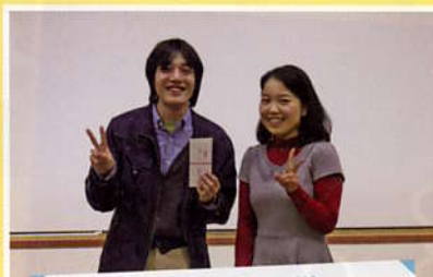
東京農業大学 清水班 [優秀賞]