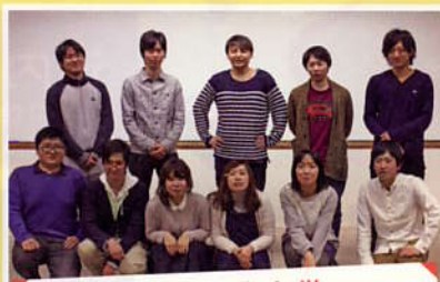
北見工業大学 石田班 [優秀賞] / 岡部班 / 鏡班 / 竹田班